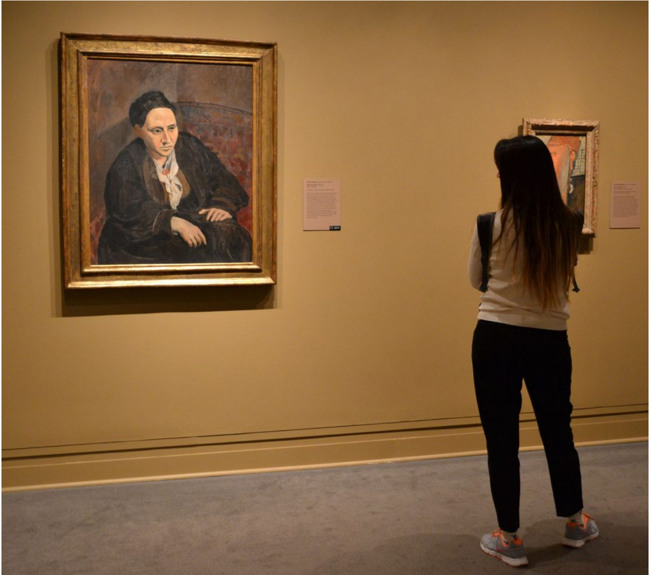
Me encontré con un Picasso