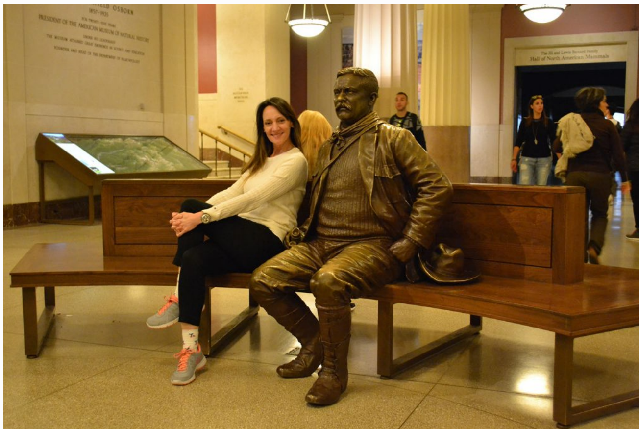
Teddy, mi amigo - Museo de Historia Natural

Estos datos están chequeados a Noviembre 2016, por supuesto todo puede cambiar así que recomiendo en caso de que lean este artículo en 2021 que rechequen por las dudas en las páginas oficiales.