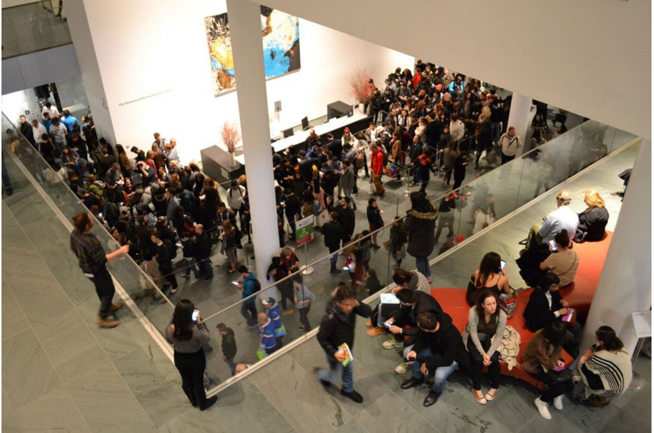
MOMA - hay gente pero entran todos